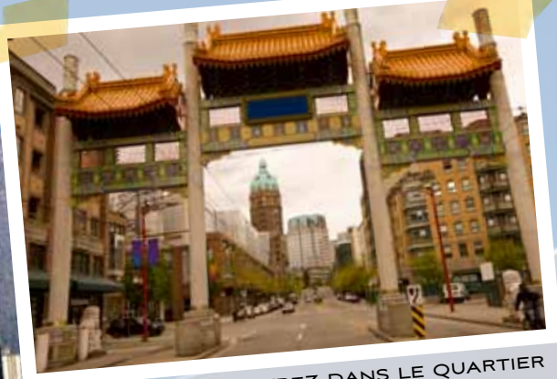
ENTREZ DANS LE QUARTIER CHINOIS DE VANCOUVER

« Si vous décidez de prévoir une visite à Whistler, assurez-vous de prévoir une journée complète. Pendant les Jeux, l'autoroute qui se rend à Whistler sera interdite aux véhicules privés, donc vous devrez prévoir suffisamment de temps pour vous rendre aux événements par transport en commun. Il pourrait falloir jusqu'à trois heures pour vous rendre et trois heures pour revenir. Cela ne laisse pas beaucoup de temps pour faire autre chose là-bas si vous souhaitez assister à une épreuve sportive à Whistler. »