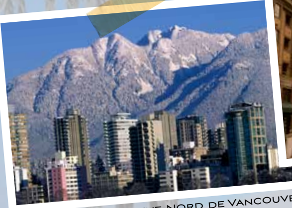
MONTAGNES DE LA RIVE NORD DE VANCOUVER