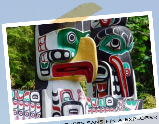
DES CULTURES SANS FIN À EXPLORER

les épreuves préliminaires et les sports moins en demande comme le biathlon. »